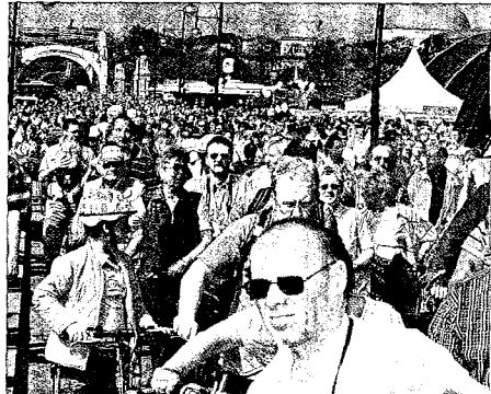
Erst will jeder einmal über die Brücke gehen. Später kehrten viele zurück, um das Bühnenprogramm mitzuerleben. Hinten die Bögen der Elbbahnhofsbrücke.