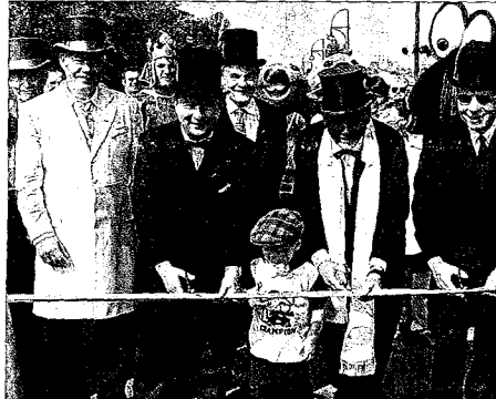
Bei der Eröffnung: OB Trümper und Minister Daehre (2.v.r.) mit Markus Rechts Beigeordneter Kaleschky. Ganz links: Achim Pohlman, Präsident Wasser- und Schifffahrtsdirektion, daneben Rolf Lack, Schifffahrtsamt.